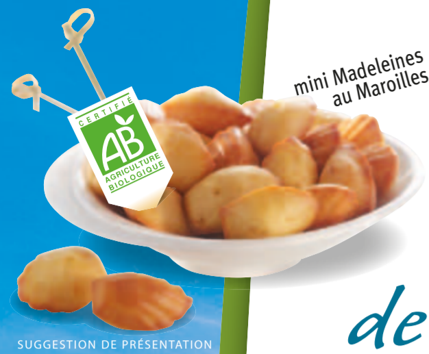
mini Madeleines au Maroilles