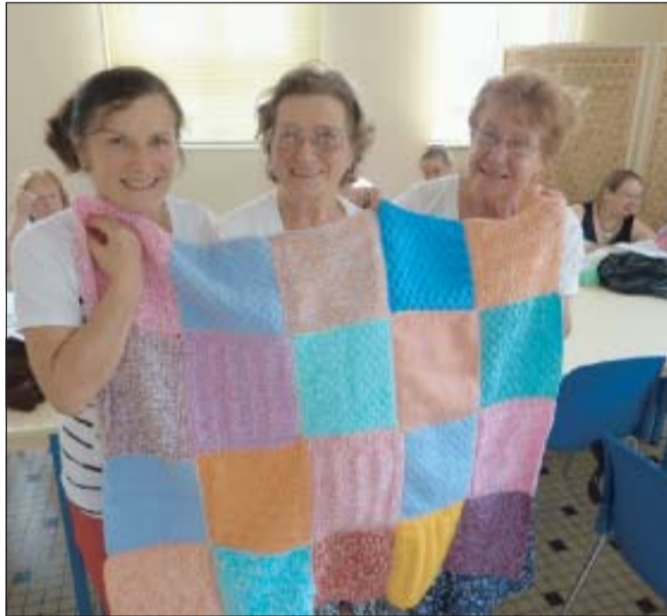
L'objectif des tricoteuses d'Escapades : confectionner 10 000 créations en laine d'ici à la fin 2014, au profit d'œuvres caritatives.

Après une participation active au défi de « L'écharpe des records », l'association Escapades Sambre-Avesnoises (ex-office de tourisme de Fourmies) poursuit l'aventure du tricot solidaire avec un nouveau challenge. À ce jour, plus de 500 œuvres en laine (poupées, couvertures, écharpes, bonnets...) ont été réalisées et récupérées par l'association fourmiesienne. Ces premières créations ont été conçues par près de 400 tricoteuses originaires de toute la France. Des relais existent aussi en Belgique, Suisse et Grande-Bretagne. L'objectif est de tricoter 10 000 créations en laine d'ici au 31 décembre 2014, au profit d'œuvres caritatives et humanitaires. Une première distribution sera organisée, cet hiver, pour les sans-abris. En fonction des premiers dons récoltés, un premier chèque sera remis en décembre à une association caritative locale. Et à l'occasion du Forum des associations, organisé par la ville, les 15 et 16 septembre, les tricoteuses d'Escapades tiendront un stand et proposeront une exposition-vente. Les tricoteuses solidaires vendront leurs plus belles créations en laine : des couvertures en patchwork, des